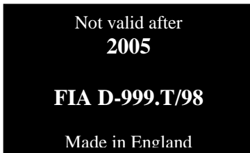
Σχέδιο 1: Ετικέτα δελτίου αναγνώρισης

Ημερομηνία λήξης ζώνης (31/12 εκείνου του έτους)